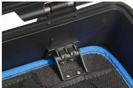
Clipsystem Système de clips