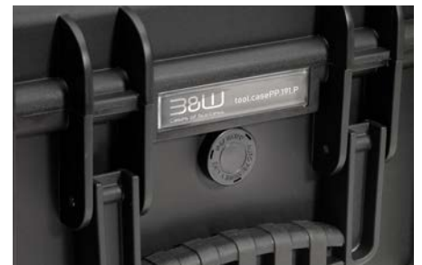
Eigentumskennzeichnung möglich Plaquette avec nom possible