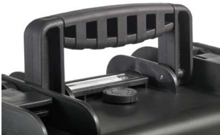
ergonomischer Griff Poignée ergonomique