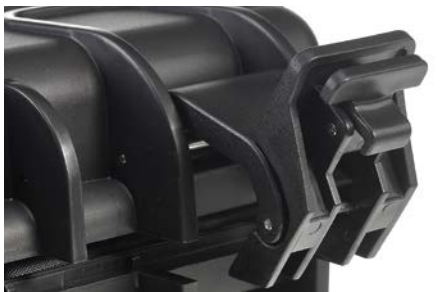
leichtgängiger Verschluss Fermeture facile