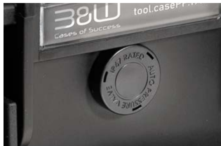
autom. Druckausgleichsventil | Soupape de compensation de pression d'air automatique