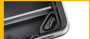
Magnetschalen für Kleinteile compartiments aimantés