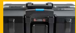
ausziehbarer Teleskopgriff poignée télescopique