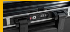
TSA Zahlencode Schloss Serrure avec système TSA