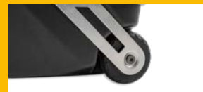
grosse Leichttauffrollen roulettes silencieuses